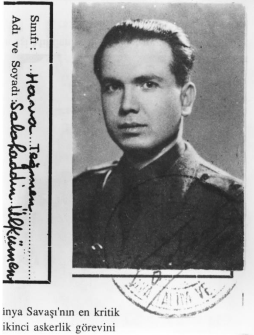
İkinci Dünya Savaşı'nın en kritik ikinci askerlik görevini