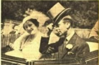
Majeste Kral Jorj ve Kraliçe Elizabeth sarayda... London 19 — Bilâhazırda... Kraliçe Mari'nin cenaze merasimi 24 temmuzda yapılacak

Kraliçe Mari'nin cenaze merasimi 24 temmuzda yapılacak