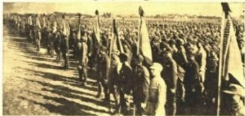
Mançuriye'de bulunan Japon askerleri bir seremoni için toplanıyor.

Yahudi meselesi Bir hadise bizi Müsevî vatandaşlarımız için acı da olsa, bazı mühim meseleler üzerinde şimdiden düşünmeğe davet ediyor