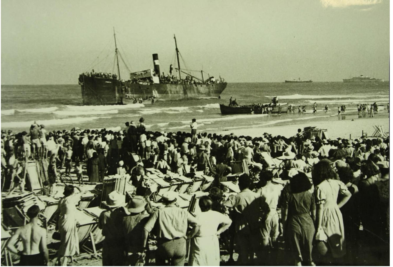
Parita Tel Aviv sahillerinde, 22 Ağustos 1939.

600 Çekoslovak Yahudisini taşıyan Parita , Köstence’den yola çıktıktan sonra Rodos’a gitti. Rodos’taki İtalyan yetkililerin gemiyi kabul etmemesi üzerine 9 Ağustos 1939’da İzmir’e geldi. İzmir Limanı yetkilileri mültecilerin İzmir’e ayak basmalarına izin vermedi. Su, kumanya ve kömürü de kalmamış olan gemideki mülteciler güvertede bekleyip bağırarak ve işaretler yaparak sahile çıkmak istediklerini bildirdiler. Buna izin verilmedi. Bir süre sonra İzmir liman yetkilileri gemiye limanı terk etmesini emretti. Gemi 15 Ağustos 1939 günü İzmir’den ayrıldı. Yarı resmi Ulus gazetesi bu haberi “Serseri Yahudiler nihayet İzmir’den hareket ettiler” başlığıyla duyurdu.