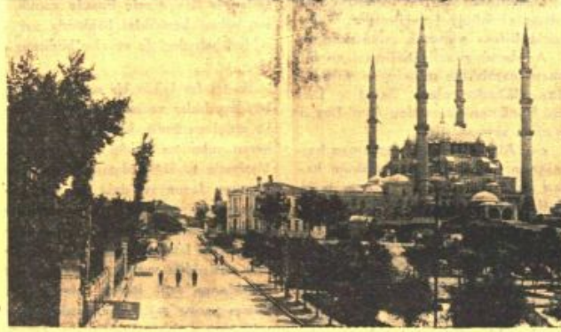
Edirne Türklüğün garbe açılan kapısı, Sultan Selim camisi de Türklüğün Acrupaya bakan abidesi olmak şerefini ebediyen muhafaza edeceklerdir

İşte cevabımız: «Evet, Edirne ebediyen Türklüğün garbe bakan abidesi olacaktır»